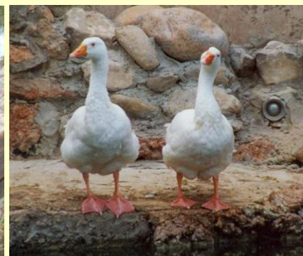
Oca domèstica blanca