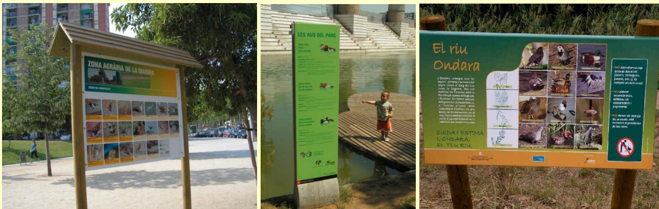
Exemples de cartells en alguns parcs urbans (Hospitalet, Barcelona, Tàrrrega).

Complements pel públic visitant: Opcionalment, cal contemplar la col·locació de cartells informatius sobre la fauna i flora. L'educació ambiental no només és una matèria adreçada únicament als escolars, sinó que és una informació de qualitat i cultural que cal adreçar a la ciutadania en general, ja que conté aspectes sobre civisme, respecte dels elements urbans i naturals, etc. Els cartells donen valor a l'espai que els conté i són una forma complementària de mostrar la sensibilitat ambiental del propietari del jardí.